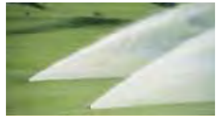
Perfekte Wasserverteilung im Nahbereich durch Diffusoren.

G roße Flächen brauchen Regner mit großen Wurfweiten. Um diese Wurfweiten auch zu erreichen mußte die Wasserversorgung bisher über einen entsprechenden Druck verfügen und die Rohrdimensionen ebenso entsprechend groß (und teuer) sein. Aber nur bisher. Denn Hunter stellt den I-60 vor: Durch eine neue Niederdrucktechnologie können trotz geringem Druck (nur 4bar) Wurfweiten von bis zu 20m erreicht werden. Beim I-60 ist auch der Wasserverbrauch geringer als bei anderen Großflächenregnern. So entfallen nicht nur zusätzliche Kosten in eine Drucksteigerungsanlage, sondern Anlagen können auch mit kleinerer Rohrdimension geplant werden. Eine tolle Sache bei engen Budgets! Auch sonst können Sie vom I-60 allerhand erwarten: Das patentierte „Precision Distribution Control“ System garantiert gleichmäßige Bewässerung auf der ganzen Distanz, der Schwenkbereich wird - so wie bei allen Hunter Regnern - leicht von oben eingestellt, das Getriebe ist widerstandsfähig und seit Jahrzehnten bewährt. Der Edelstahlaufsteiger schützt nochmals vor Verschleiß. Der I-60 ist wirklich eine ökonomische Entscheidung die leicht fällt!